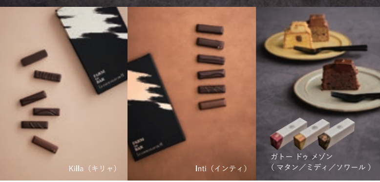
Killia (キリヤ) Inti (インティ)