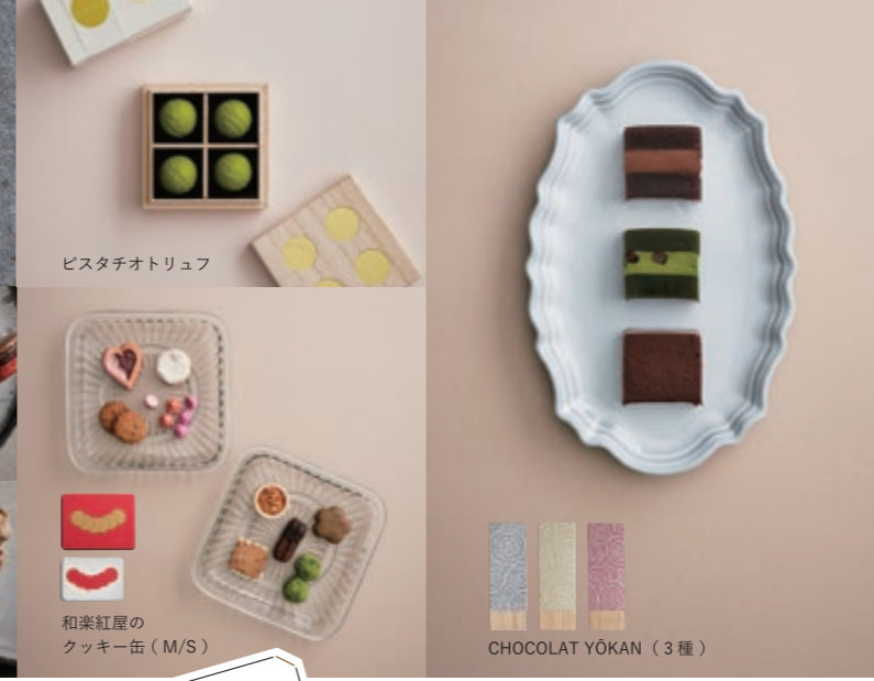
ピスタチオトリュフ 和楽紅屋のクッキー缶 (M/S) CHOCOLAT YOKAN (3種)