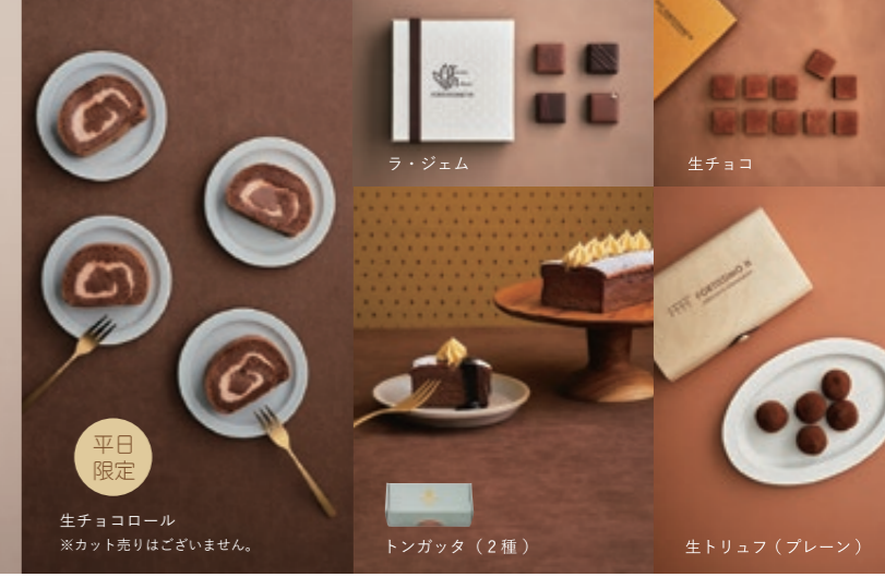
平日限定 生チョコロール ※カット売りはございません。 ラ・ジェム トンガッタ (2種) 生トリュフ (プレーン)