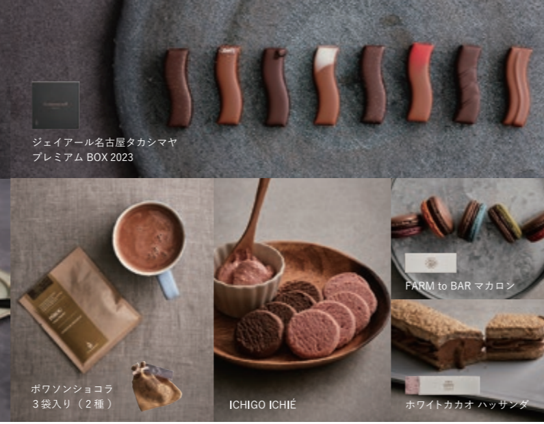
ジュエル名古屋タカシマヤ プレミアム BOX 2023